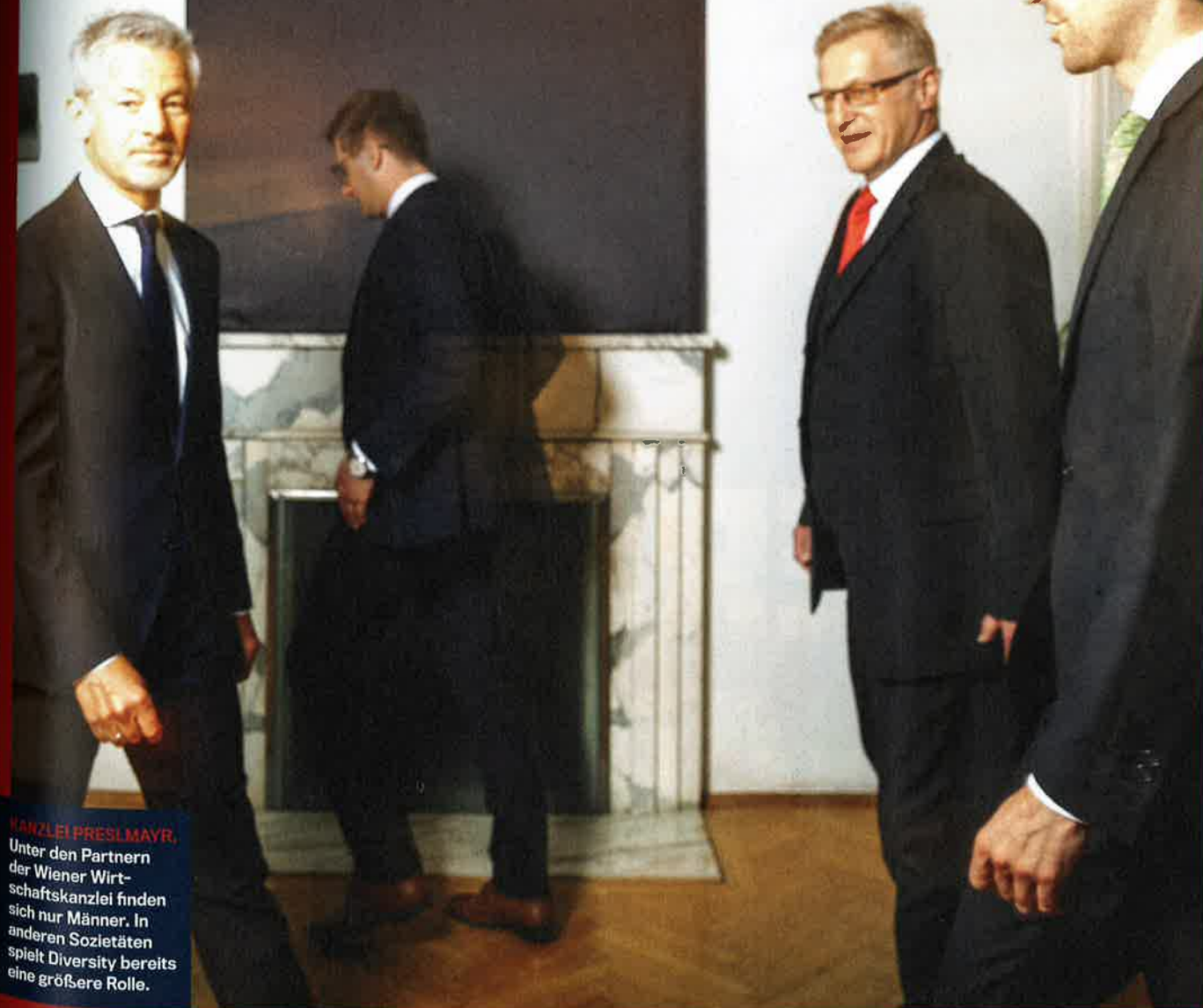
KANZLEI PRESLMAYR. Unter den Partnern der Wiener Wirt- schaftskanzlei finden sich nur Männer. In anderen Sozietäten spielt Diversity bereits eine größere Rolle.